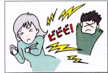
防犯ブザーなどを鳴らす。