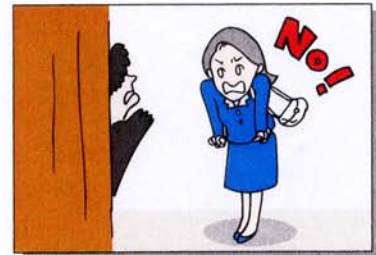
ストーカーや痴漢の疑いのある者には、き然とした態度で対応する。(付け込まれない。)