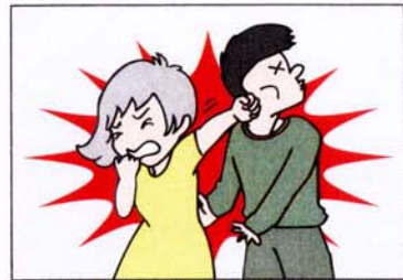
とにかく抵抗する。