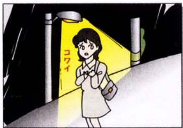
暗い夜道の一人歩きはしない。