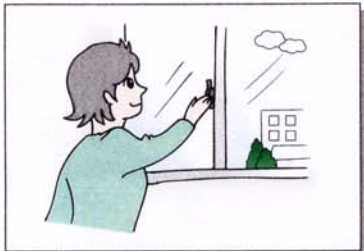
日ごろからしっかり戸締りをする。(2階以上の部屋であっても)