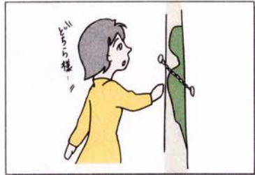
来客にはドアチェーンをかけて対応する。