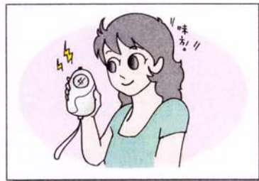
防犯ブザーを持つ。