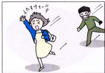
大声を出し、助けを求める。近くの家や店に飛び込んで助けを求める。